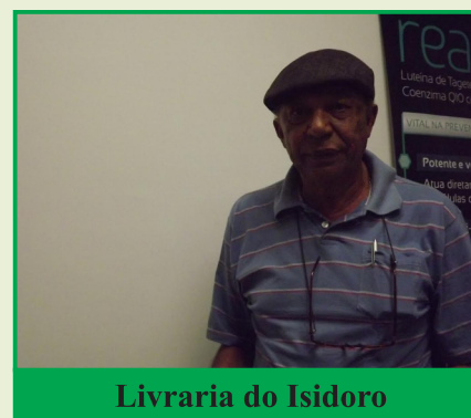
Livraria do Isidoro