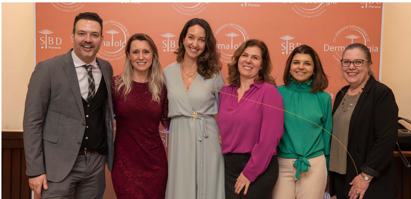
Diretoria SBD-PR no biênio 2021-2022