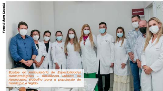
Equipe do Ambulatório de Especialidades Dermatológicas – Residência Médica de Apucarana: trabalho para a população do município e região

A equipe é integrada por seis residentes, cinco dermatologistas, um cirurgião plástico, um cirurgião dermatológico com formação em dermatoscopia, um cirurgião oncológico, um patologista, uma micologista, uma enfermeira e uma auxiliar de enfermagem.