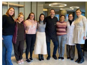
durante os preparativos para as aulas on-line, a equipe fez uma pausa para registrar este encontro de craques da dermatologia

Veja mais fotos dos bastidores do Projeto Científico 2022 na página 11.