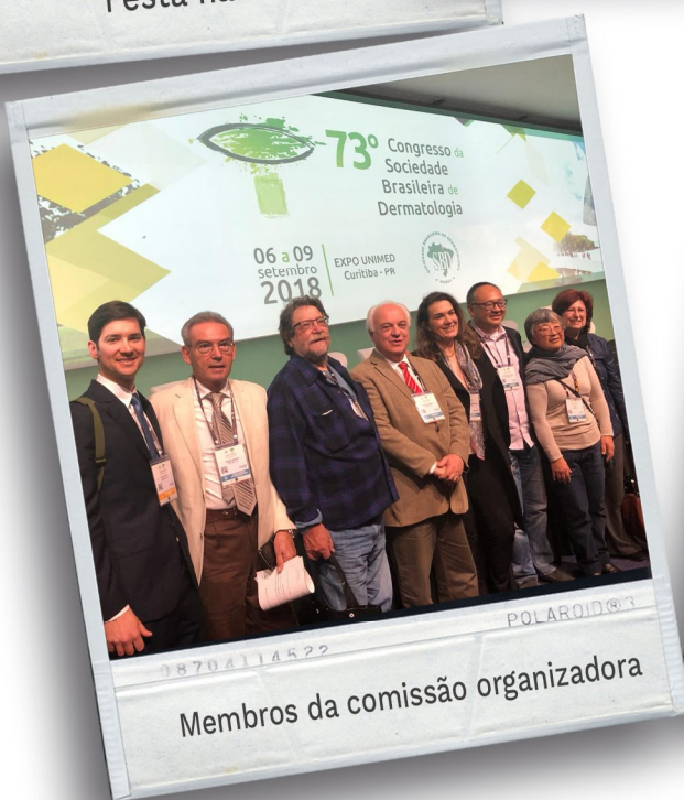
Membros da comissão organizadora