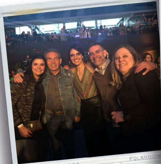
Festa na Arena